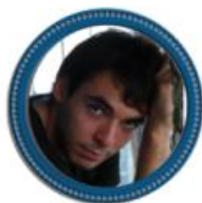
Eric J. Lagarrigue Editorial